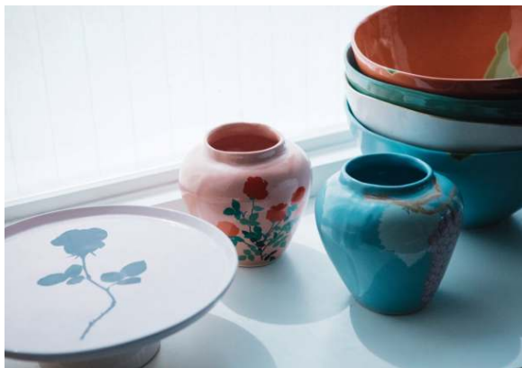
BOVEN OOK IN HET SERVICIES VAN BERNADETTE ZIJN DE ZELF GETEKENDE BLOEMENPRINTS DE BLIKVANGER.

'Maar iets negatiefs over Char? Ik zou echt niks kunnen bedenken. Ik denk dat het grootste punt van kritiek uit onze omgeving zou kunnen komen: voor hen is het soms