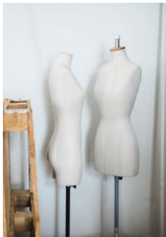
BERNADETTE, ONDER MEER TE KOOP BIJ GRAANMARKT 13 EN RENAISSANCE IN ANTWERPEN. VOOR MEER VERKOOPPUNTEN EN ONLINE SHOP: BERNADETTEANTWERP.COM MADE BY BERNADETTE, TE KOOP BIJ SKETCH IN KNOKKE EN RENAISSANCE ANTWERPEN.

CHARLOTTE: 'Door samen te werken kunnen we veel tijd in elkaars gezelschap doorbrengen. Mijn moeder is een heel grappige, optimistische vrouw. Ik ben van nature heel verlegen, en bij een stressvolle meeting voel ik me stukken beter met mijn moeder erbij. Elke situatie maakt zij lichter en leuker. Ik kan me niemand voorstellen met wie ik liever dit avontuur zou aangaan dan met haar.' ♦